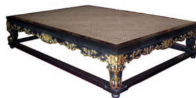
3. Sập dùng trong Hoàng cung