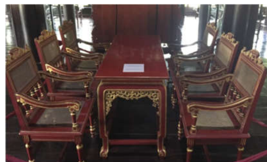
4. Bàn ghế trưng bày tại Bảo tàng Mỹ thuật Cung đình Huế