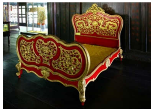
2. Giường của Vua Bảo