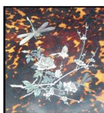
Hình 10. Hoa văn châu Âu trên đồ gỗ Hoàng cung