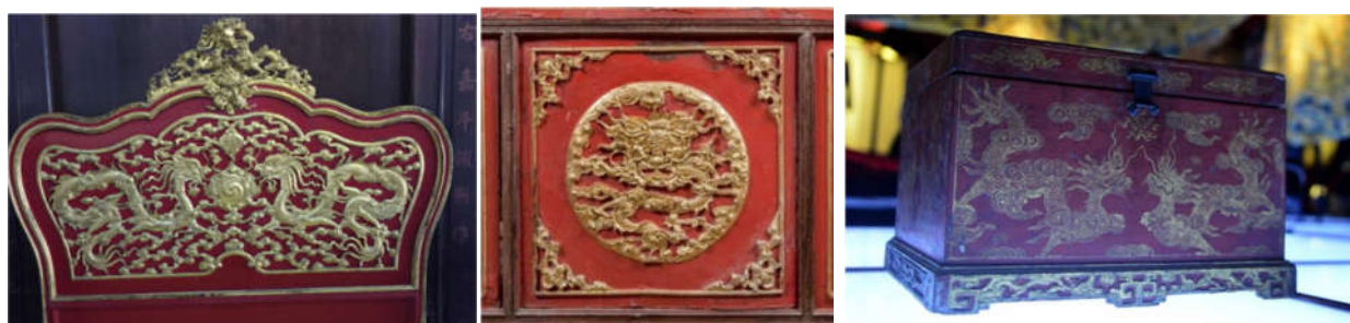
Hình 7. Hoa văn rồng trang trí trên đồ gỗ Hoàng Cung