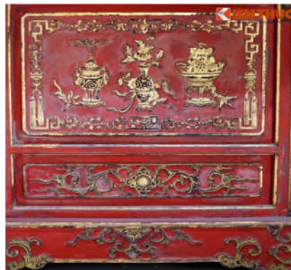
Hình 9. Hoa văn cổ vật trên đồ gỗ Hoàng Cung

Ngoài hoa văn truyền thống, đồ gỗ Hoàng cung còn có rất nhiều hoa văn châu Âu như hoa hồng, hoa văn dây leo, vỏ sò, vỏ ốc... những hoa văn biểu trưng cho sự trường tồn