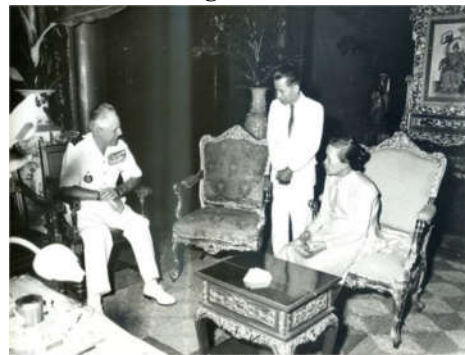
Hình 4. Sản phẩm đồ gỗ Hoàng cung mang phong cách châu Âu cổ điển Rococo