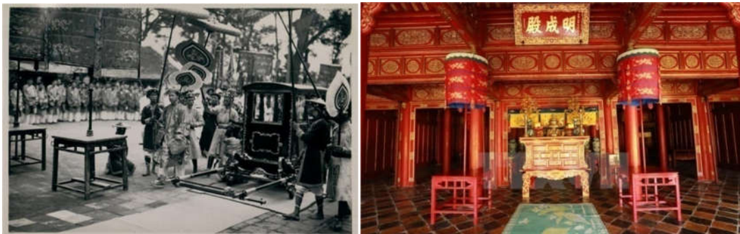
Hình 2. Đồ mộc Hoàng cung Triều Nguyễn mang phong cách thời nhà Minh Trung Quốc

Trong giai đoạn này các Vua Nguyễn tư tưởng giảm quan hệ với Tây phương, thực hiện chính sách bế môn toả cảng đoạn tuyệt với Tây phương, quan hệ chủ yếu với Trung Quốc, do vậy tư tưởng Trung Quốc ảnh hưởng rất lớn đến Vua và Triều đình Nguyễn trên tất cả phương diện văn hóa, kinh tế, nghệ thuật. Vì vậy cùng với sự ảnh hưởng đó kiến trúc, hội họa, đồ nội thất cũng bị ảnh hưởng lớn.