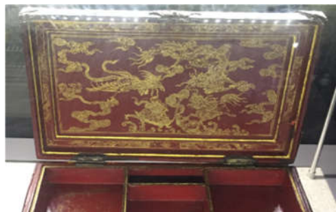
Hình 8. Hoa văn Phượng trên Kiệu Hoàng Hậu Từ Cung và trên hộp trang sức

Hoa văn tứ linh chiếm 11,76% trên tổng sản phẩm như Rùa, Kỳ lân. Kỳ lân là một con vật tưởng tượng, có đầu Rồng thân thú, biểu tượng cho sự trường thọ, oai phong, báo hiệu điềm lành. Hình tượng Rùa là một biểu tượng thiêng liêng, là linh vật mang đến điềm lành, trường thọ cho con người.