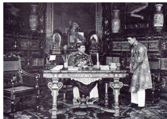
2. Bàn và ghế Vua Khải Định Điện Cần Chánh