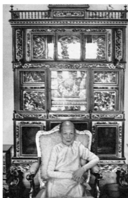
1. Tủ của Đức Từ Cung Hoàng Thái Hậu