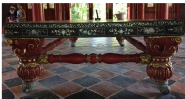
3. Sập trưng bày lăng Minh Mạng