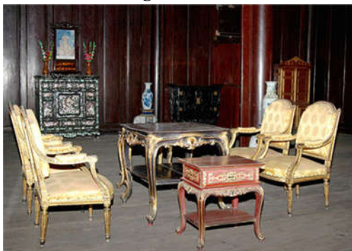
3,4. Bàn ghế tiếp khách sử dụng trong Hoàng Cung thời Vua Khải Định