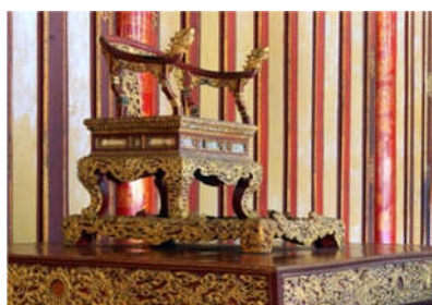
1. Ngai vàng Triều Nguyễn