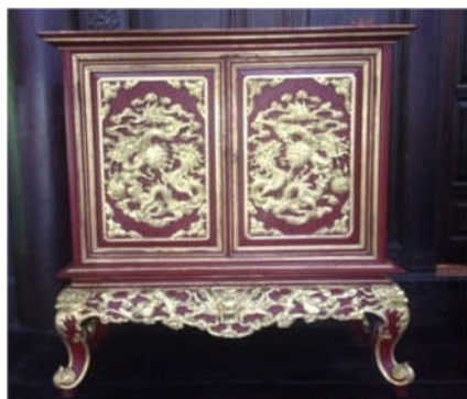
1. Tủ đựng đồ của Vua Bảo

phẩm mộc Triều đình làm theo phong đồ châu Âu bởi người thợ Việt Nam.