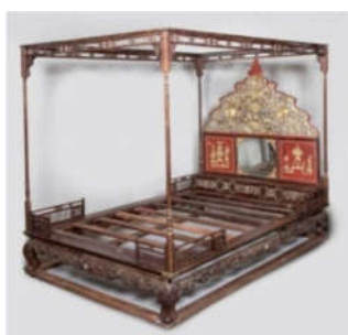
2. Long sàng Vua Thành Thái