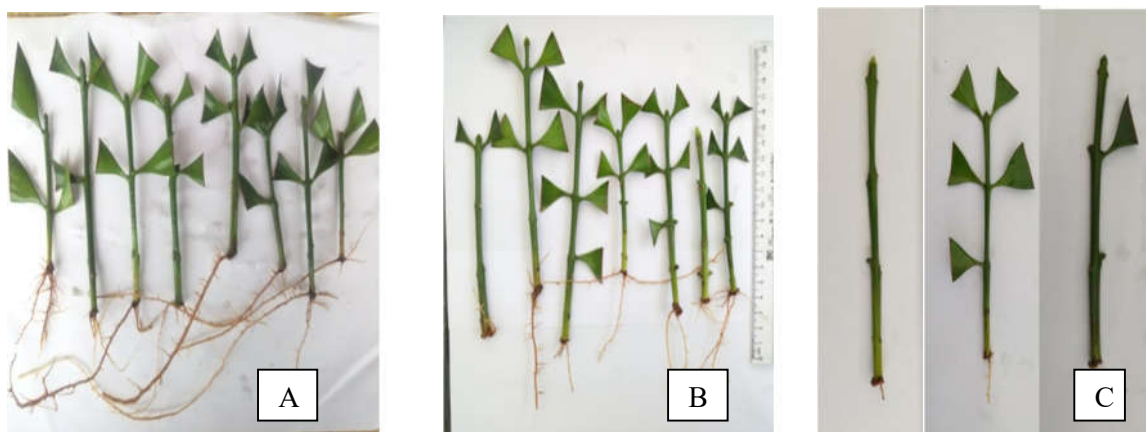
Hình 1. Cây Kim giao sau 10 tuần giâm hom IBA 300 ppm dạng bột (hình a) IBA 250 ppm dung dịch (hình b) và đối chứng (hình c)

ppm và 500 ppm dạng bột cho tỷ lệ hom ra rễ khá cao (tương ứng đạt lệ 95,6% và 92,2%), gấp hơn 11 lần so với đối chứng. So sánh với nghiên cứu của Hà Thị Thuý Hằng (2014) về nhân giống hom Kim giao tác giả cũng sử dụng IBA ở nồng độ cao hơn 700 ppm song cho tỷ lệ hom ra rễ chỉ đạt 76,67%. Có thể thấy nồng độ IBA ở nồng độ thích hợp sẽ có tác dụng kích thích hom ra rễ, khi dùng với nồng độ cao sẽ kìm hãm khả năng ra rễ của hom. Như vậy, để giảm giá thành cây con trong sản xuất có thể lựa chọn IBA 300 ppm dạng bột là phù hợp.