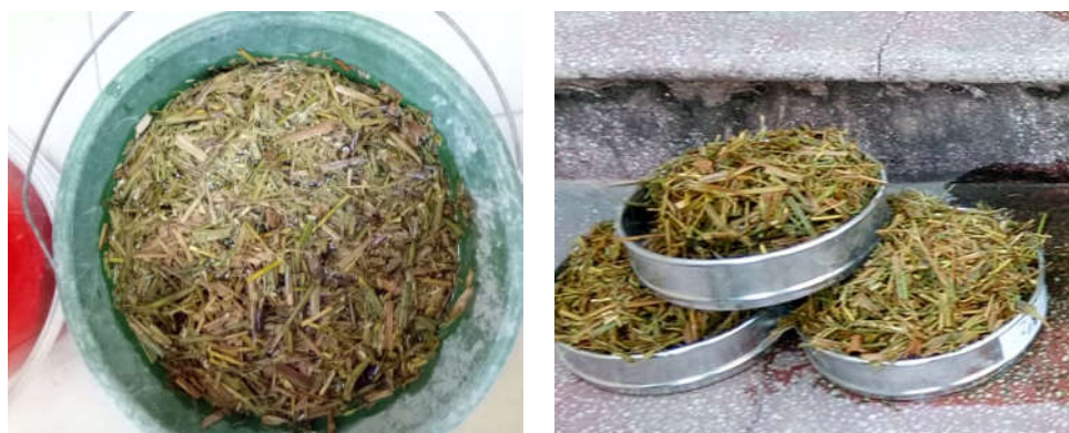
Hình 1. Quy cách và quá trình xử lý rơm