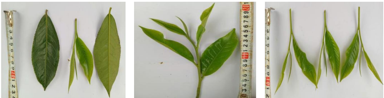
Hình 3. Búp và lá chè Shan cổ thụ Núi Bóng tại xã Đức Lương, tỉnh Thái Nguyên

Do cây chè Shan cổ thụ có chiều cao lớn (nhiều cây cao trên 20 m), người dân áp dụng hình thức thu hái thủ công bằng cách trèo cây hoặc cắt cành ở những vị trí khó tiếp cận, sau đó thu hái búp và lá non. Phụ nữ dân tộc Tày thường đảm nhiệm việc hái búp và lá chè, trong khi nam giới hỗ trợ các công việc liên quan đến leo trèo và cắt cành. Phương pháp hái phổ biến là hái "một tôm hai lá" hoặc "một tôm ba lá", sử dụng kỹ thuật hái bằng tay ("miệng hổ") nhằm hạn chế làm dập nát búp chè.