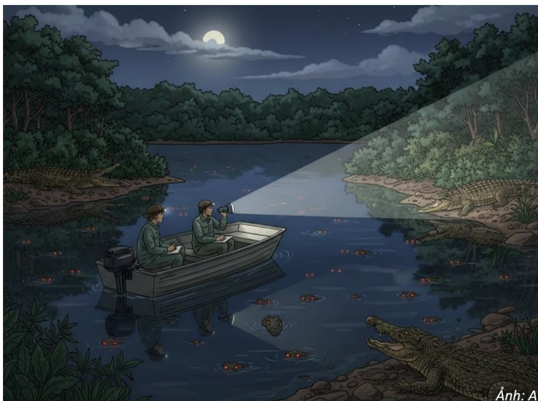
Hình 1. Hình ảnh minh họa phương pháp điều tra cá sấu theo tuyến

Khảo sát được tiến hành vào 2 khoảng thời gian trong ngày: từ sau khi trời tối hoàn toàn đến trước nửa đêm, thời điểm cá sấu hoạt động nhiều và dễ quan sát nhất; và từ khi trời sáng mặt trời bắt đầu xuất hiện đến khoảng 9-10 h thời điểm nắng vừa lên cá sấu có thể sẽ lên bờ để phơi nắng tạo điều kiện thuận lợi cho việc quan sát trong quá trình điều tra. Một thuyền nhỏ hoặc xuồng máy được sử dụng để di chuyển dọc tuyến với tốc độ chậm, thường từ 5-10 km/h nhằm hạn chế làm cá sấu lặn mất dấu. Người quan sát dùng đèn pha công suất lớn hoặc đèn pin thông thương quét liên tục theo hình vòng cung qua mặt nước và hai bên bờ. Khi phát hiện ánh mắt phản chiếu, nhóm nghiên cứu ghi nhận vị trí GPS, khoảng cách ước tính đến đối tượng, kích thước tương đối của cá thể (dựa trên độ lớn phần đầu và khoảng cách hai mắt), cùng các ghi chú về hành vi, điều kiện thời tiết, độ trong nước. Trường hợp cá thể cho phép tiếp cận gần, nhà nghiên cứu có thể ước tính chiều dài cơ thể theo các tiêu chí chuẩn hóa đã được thiết lập trong các nghiên cứu như Messel và cộng sự (1981).