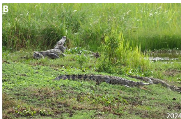
Hình 2. Các cá thể cá sấu được chụp lại trong quá trình giám sát tại Bàu Sấu, VQG Cát Tiên