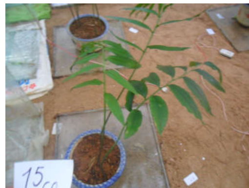
Hình 03. Cây Hoàng tinh vòng trước khi tiếp xúc với khí CO