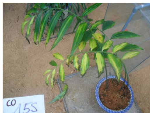
Hình 04. Cây Hoàng tinh vòng sau khi tiếp xúc với khí CO