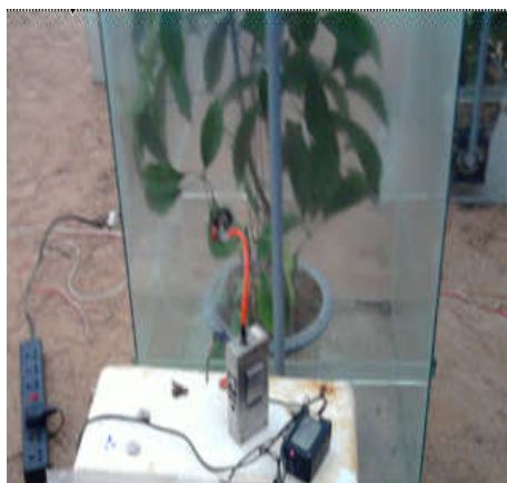
Hình 01. Lấy mẫu khí carbon monoxide

Khoảng nồng độ tiếp xúc: Nồng độ CO cho phép trong môi trường lao động là 20 \text{ mg/m}^3 theo tiêu chuẩn Vệ sinh an toàn lao động của Bộ Y tế năm 2002. Tuy nhiên, theo Quy chuẩn chất lượng không khí xung quanh (QCVN 05, 2009) của Bộ Tài nguyên và Môi trường thì nồng độ khí CO cho phép là 10 \text{ mg/m}^3 . Vì vậy nồng độ carbon monoxide đầu vào trong các buồng thí nghiệm của nghiên cứu này đã được xác định trong khoảng từ 15 - 18 \text{ mg/m}^3 .