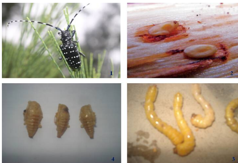
Hình 01. Xén tóc vân hình sao ( Anoplophora chinensis Forster)