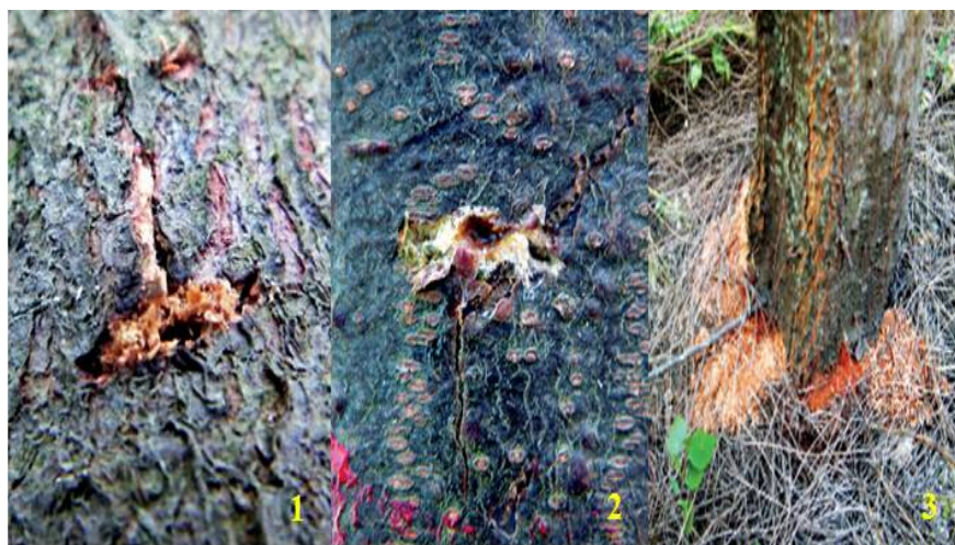
Hình 02. Dấu hiệu nhận biết của Xén tóc vằn hình sao

số loài giai đoạn phá hại lại sống trong thân cây nên việc nhận biết chúng gặp rất nhiều khó khăn. Việc nghiên cứu các đặc điểm nhận biết nhanh, và sớm các loài sâu hại sẽ góp phần chủ động trong việc thực hiện có hiệu quả công tác phòng chống sâu hại.