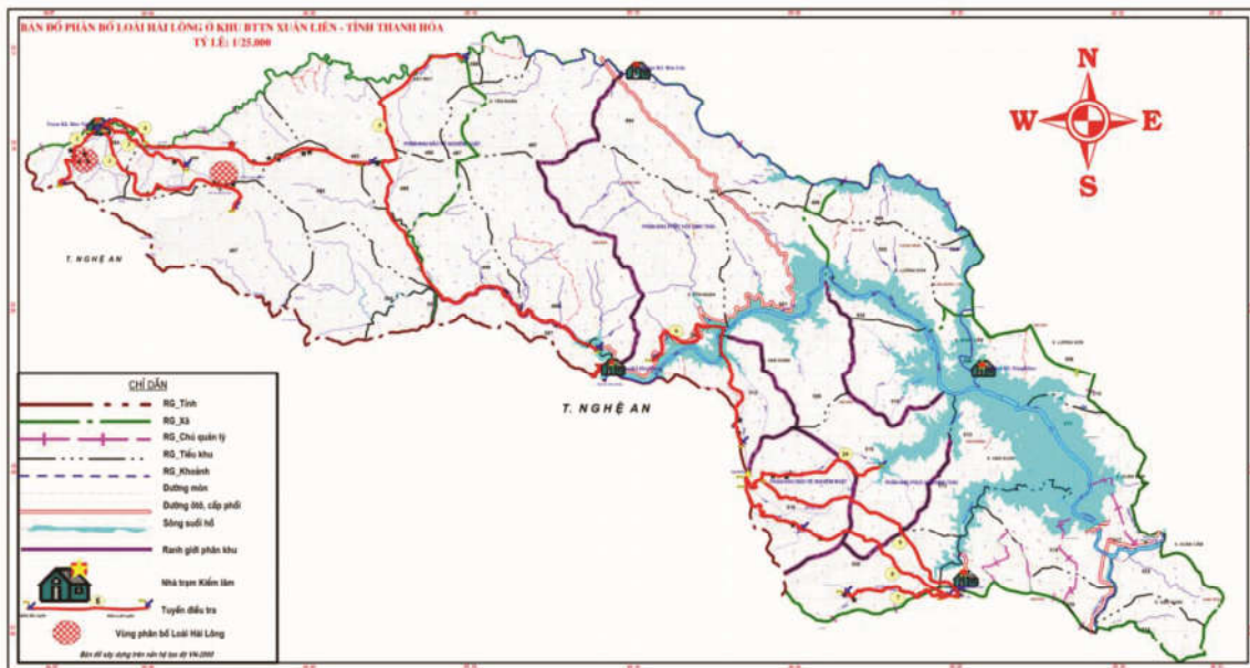
Hình 3.2. Bản đồ phân bố lan Hải long tại Khu BTTN Xuân Liên (điểm tròn đỏ)

biến ở đây, đặc biệt như Aerides odorata , Bulbophyllum purpureifolium , B. ambrosa , Dendrobium aduncum ,... Các loài cây ưu thế là các cây lá rộng ở kiểu rừng này thường gặp như Burretiodendron hsienmu (Tiliaceae), Meliaceae, Cinnamomum sp., Ficus spp. (Moraceae), Quercus sp. (Lauraceae),... những cây ở lớp Thông như Amentotaxus argotaenia , Calocedrus macrolepis ,... đôi khi cũng có mặt nhưng ở độ cao 900 -1000 m. Rất nhiều loại mọc trên đá cũng có mặt ở đây đặc biệt các loài trong họ Acanthaceae, Araceae, Rubiaceae, Urtiaceae và các loài Cói, Dương xỉ bám đá.