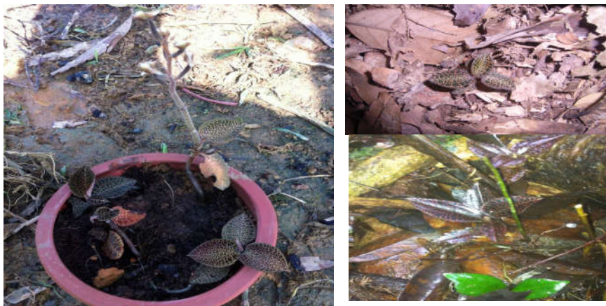
Hình 3.3. Kim tuyến trung bộ (Bản Vện-Bát Mọt) (bên phải) và tại Vườn sưu tập lan (bên trái) Khu BTTN Xuân Liên

- Đặc điểm của hoa, quả: Cụm hoa dài 10 - 20 cm, ở ngọn thân, mang 4-10 hoa mọc thưa. Lá bắc hình trứng, dài 6-10 mm, màu hồng. Các mảnh bao hoa dài khoảng 6 mm; cánh môi màu trắng dài đến 1,5 cm, mỗi bên góc mang 6-8 dải hẹp, đầu chẻ đôi. Mùa hoa tháng 10 - 12. Mùa quả chín tháng 12-3 năm sau.