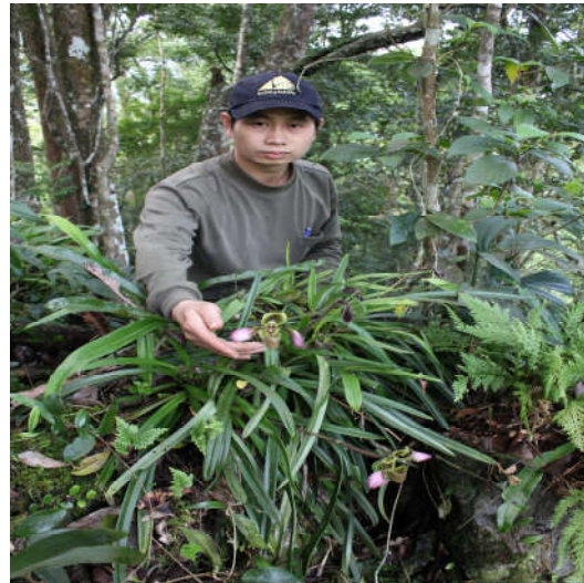
Hình 4.3. Lan hài lông – Bản Vịn Bát Mọt