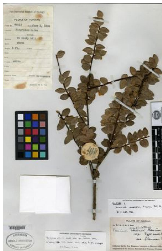
Hình 02. Mẫu tiêu bản chuẩn tại Đại học Harvard, Hoa Kỳ